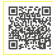
ROBOT-Drive: Technische Details