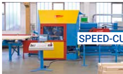
SPEED-CUT 3 (SC3)